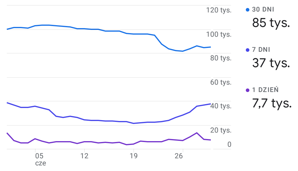
Aktywność użytkowników na przestrzeni czasu