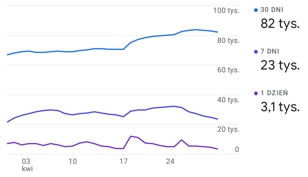
Aktywność użytkowników na przestrzeni czasu