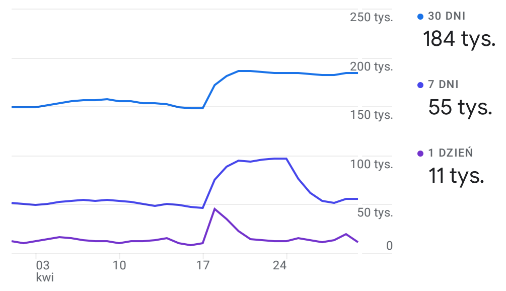
Aktywność użytkowników na przestrzeni czasu